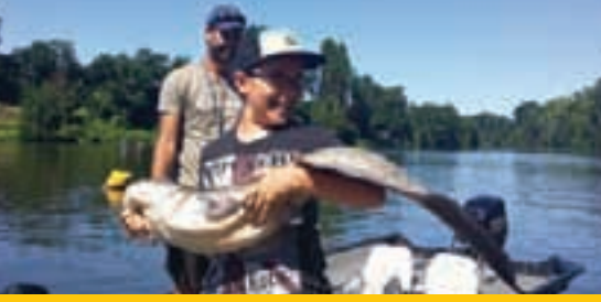
Initiation pêche en bateau sur le Lot

Domaine de choix des pêcheurs sportifs, les grands cours d'eau Lot-et-Garonnais regorgent de poissons trophées. La réputation de certains parcours de pêche dépasse même nos frontières, donnant au Lot-et-Garonne un caractère évident d'attractivité en matière de tourisme pêche. La pêche familiale a aussi pleinement sa place avec des parcours très agréables.